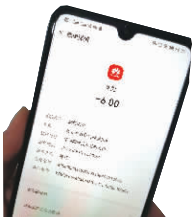
3月13日，记者体验开心消消乐游戏，在无实名认证的情况下充值成功。

3月13日，记者体验时发现，《开心消消乐》在未实名认证的情况下可以充值。记者在进入《开心消消乐》游戏后，显示“微信登录”“游客登录”“其他方式”三种登录方式。记者选择微信登录之后，在游戏界面的左上角有“实名认证”的图标，里面是关于“身份证实名指引”的相关内容，要求用户进行实名认证，并提示“紧急！未完成实名注册，将无法登录游戏”。但在未实名认证的前提下，仍能正常进行游戏充值。