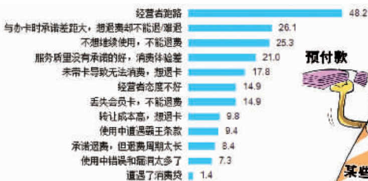
预付式消费维权最令消费者不满的问题

3月13日,湖南省消费者委员会发布《2019年湖南省预付式消费维权状况调查报告》。据了解,2019年9月至12月,省消委联合相关调查机构,对预付式消费人群人口学特征、消费状况、消费维权状况、存在的问题和解决的建议等五个方面内容进行了相关调查和统计。数据显示,预付消费最为常见的行业分别为服装鞋类保养、餐饮和保健养生,而最令消费者诟病的问题是经营者跑路,占比达48.2%,排在最令消费者不满意问题的榜首。 ■记者 朱蓉