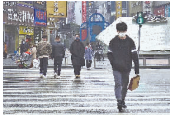
2月25日晚，长沙的城市干道上重现“车水马龙”，交通流量在逐步增大，部分商超和餐饮的也复工开门，人气正在慢慢回升。