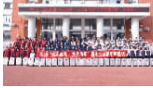
2019年“福泽潇湘·扶贫助学”公益活动凤凰发放仪式。