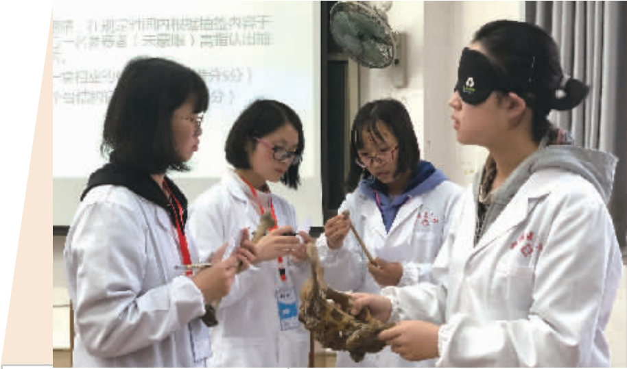
10月19日上午，中南大学湘雅医学院举行第一届识骨大赛。记者 刘镇东 摄

截至目前，两家医院已为6个β地中海贫血家庭开展单细胞PGD-HLA配型检测。其中，有5个家庭筛选到无患β地中海贫血风险、其HLA与β地中海贫血患儿完全匹配的胚胎各1枚。这5个家庭的命运将被彻底改变。