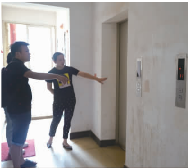
8月30日,记者在美林景园小区12栋1号电梯现场走访。电梯门口张贴着电梯未过年检的通知。

一面是验收还没开始,另一面,尽管1号电梯门口张贴着电梯未过年检存在危险的通知,业主们却熟视无睹,照乘不误。栋长唐铭蔚说:“这栋基本每户都有人被电梯关过,大家都习以为常了。”