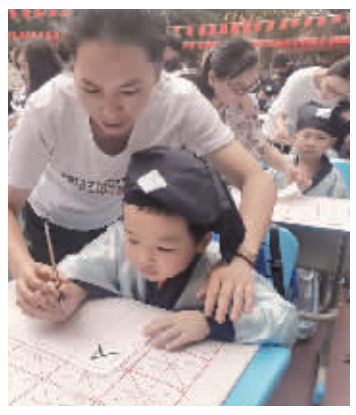
新生入学写“人”字。