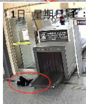
8月11日,新化火车站安检口,5岁男孩小晏手卡安检传送带,20多分钟后安全获救。