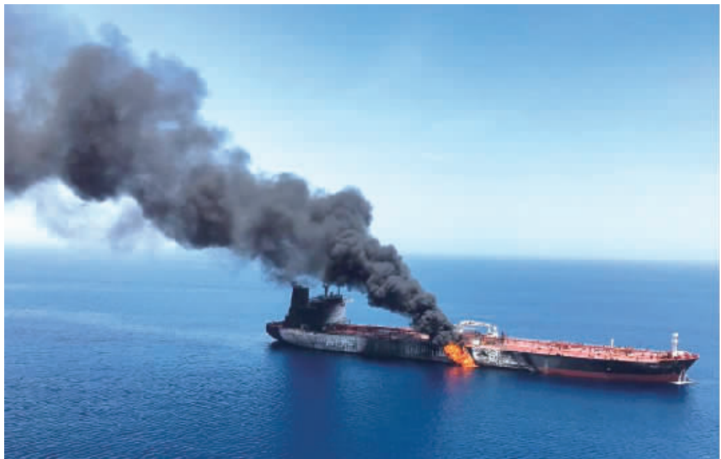
6月13日,一艘油轮在阿曼海上起火。

联合国秘书长古特雷斯13日呼吁有关方面查明事件真相,并强调世界无法承受海湾地区发生严重对抗。