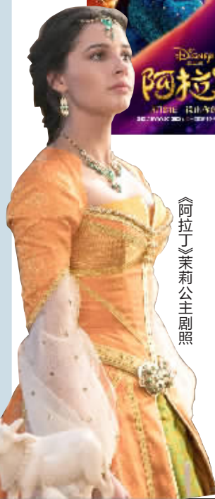
《阿拉丁》茉莉公主剧照