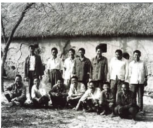
左图为1981年,部分“大包干”带头人在茅草屋农舍前合影;右图为1978年冬,小岗村农民按下红手印的“大包干”契约(资料照片)。