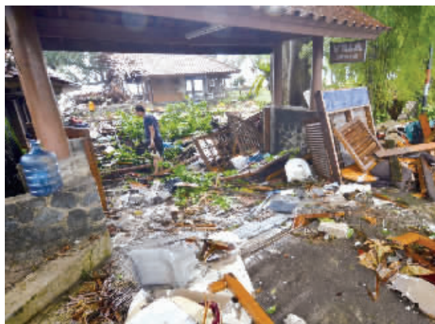
2018年12月22日印尼发生海啸，伤亡惨重。