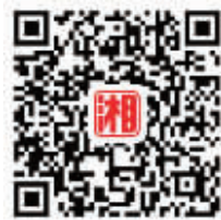
扫描二维码可看超市名单