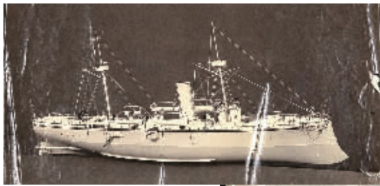
英国纽卡斯尔的泰恩—威尔档案馆拍摄的馆藏照片。

两米长的淡黄色亚麻纸已褶皱卷边，图纸上“Cruisers. Nos493&4”(“巡洋舰编号493和494”)字迹工整、墨迹清晰……尘封百年，甲午海战中抗击日舰后沉没的清北洋海军致远舰部分原厂设计图纸在其建造地——英国纽卡斯尔市的一家档案馆首次被发现，为打捞那段悲壮的历史提供了重要参考。专家认定其意义重大，为从军舰结构上剖析致远舰在甲午海战中的沉没原因提供了新的角度与可能。