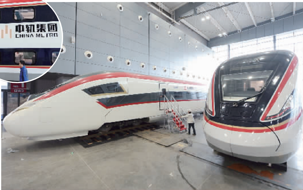
11月14日,长沙国际会展中心,两列新型双层动车组亮相2018中国(湖南)国际轨道交通产业博览会展区。据悉,这是该型车组的首次“出境”。