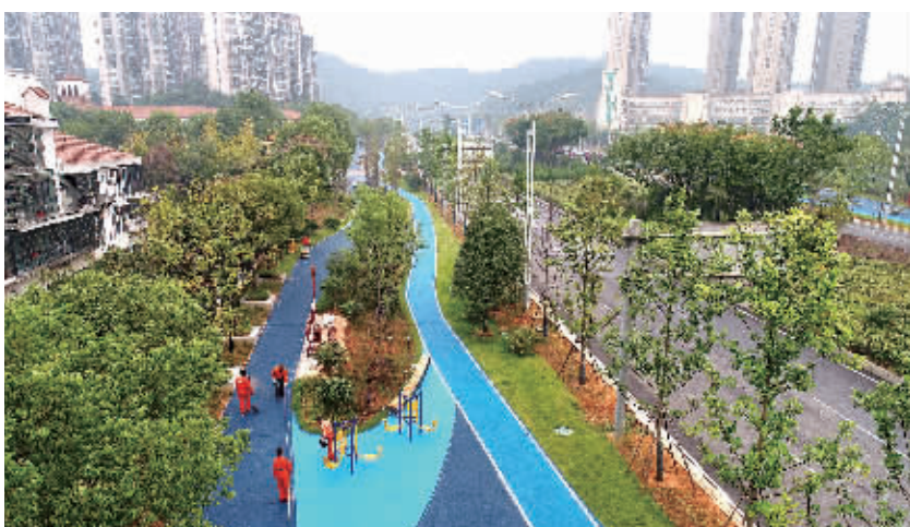
“公园”就在家门口!近年来,长沙市积极推进宜居环境建设,提升城市品质。

近年来,长沙在城市建设中,坚持以人民为中心的发展思想,从有效解决居民日常痛点出发,不断提升完善城市公共服务功能,通过“一圈两场三道”工作推进,着力一站式解决市民生活琐事,随着长沙15分钟便民生活圈陆续投用,老百姓的幸福感不断升级。