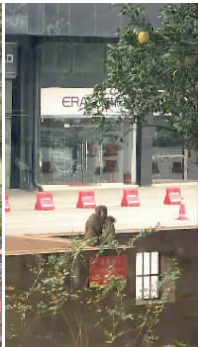
长沙湘江豪庭小区发现猴子出没。