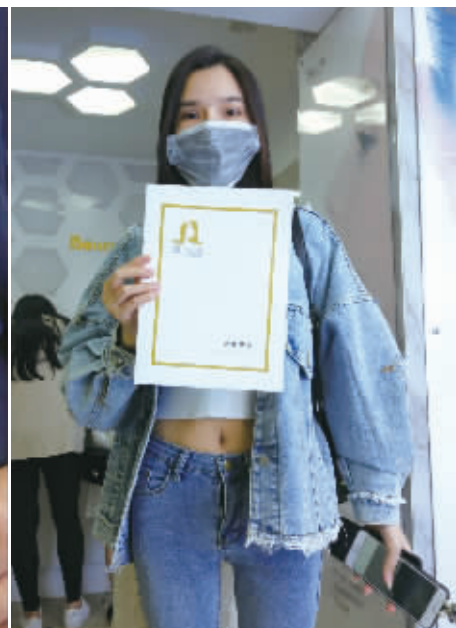
多名受害人向记者展示“贷款代还”的合同。