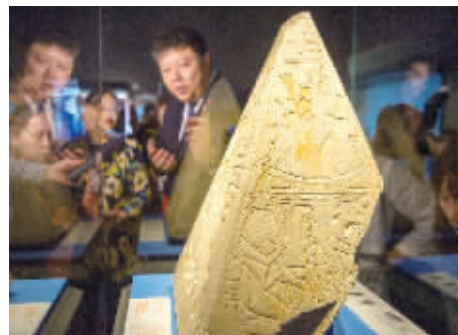
9月28日,“法老·诸神·木乃伊——古埃及文物特展”正式亮相湖南省博物馆,吸引了众多市民和游客前去观展。本次特展持续至12月5日。