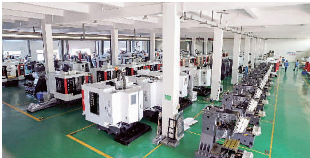
嘉禾县塘村镇，智能化锻造生产车间。