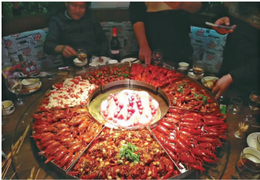
四方商贸城夜宵街的口味虾。

更重要的是,来这里不仅可以品味美食,更能品味长沙千年的历史人文。“节假日里,一天人流量可达五六十万。”坡子街社区书记曾灿波介绍,现在坡子街已成为长沙美食旅游的一张名片。