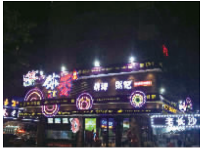
湘江世纪城夜宵街。