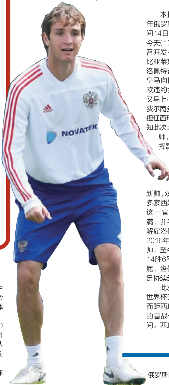
俄罗斯队备战世界杯。