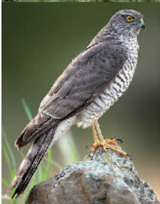
◀国家二级保护动物雀鹰