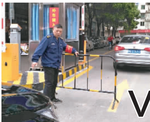
4月15日，白天保安归位，盘查外来车辆。