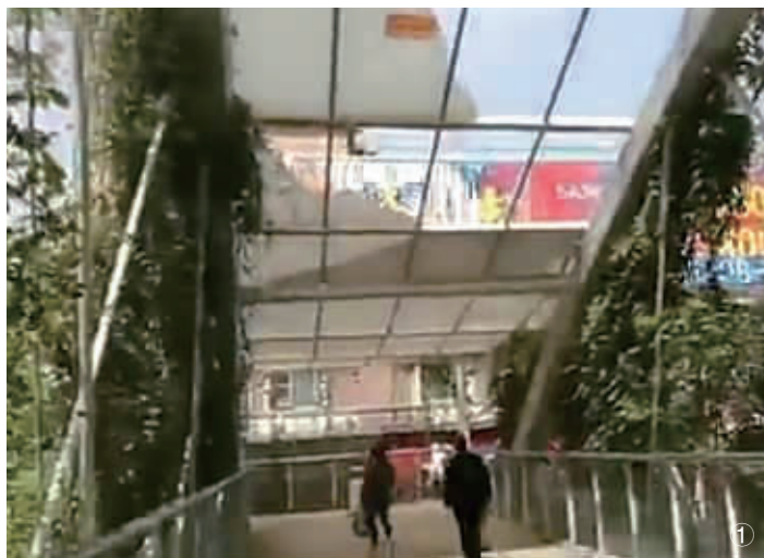
图①图②:长沙东二环建市场门口的一座人行桥顶部,阳光板多处破损,随时可能脱落,存安全隐患。(视频截图)