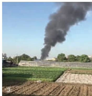
图③:7日,长沙火车站附近仓库起火,冒出滚滚浓烟。