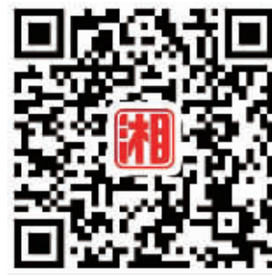
扫描二维码,观看相关视频