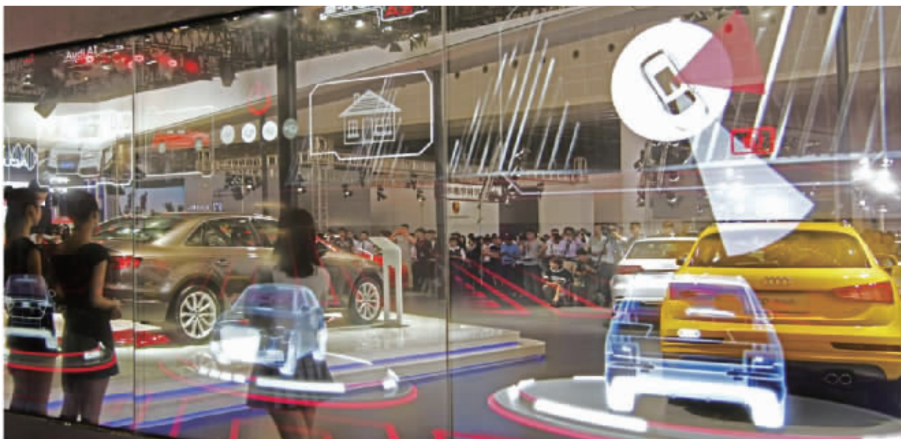
往届湖南车展现场。(资料图)