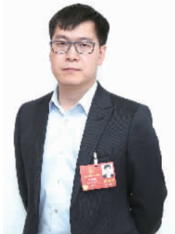
全国人大代表、58集团首席执行官姚劲波

当传统农业撞上移动互联网,能碰撞出什么特别的火花?3月4日下午,全国人大代表、58集团首席执行官姚劲波在接受本报记者采访时表示,有了互联网的加入,乡村振兴也可以很炫很有科技感,他建议加强“三农”信息化建设,加快智慧乡村建设,用互联网思维激活农村新动能,让乡村变得更美好、更有活力。