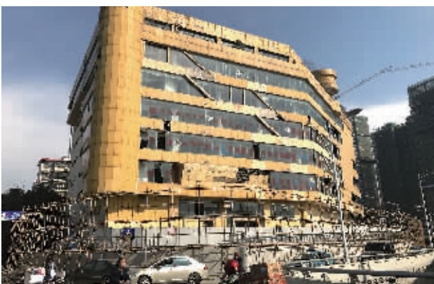
2月6日, 维多利购物中心大楼前已开始搭建脚手架, 拆除工作进入倒计时。

长沙伍家岭商圈维多利购物中心自2007年开始处于关闭状态, 2017年12月启动房屋收购工作(本报2017年12月23日A03版报道)。2月6日, 三湘都市报记者从长沙开福区新河街道了解到, 维多利购物中心房屋收购工作已基本完成, 拆除工作也已开始进行前期准备。