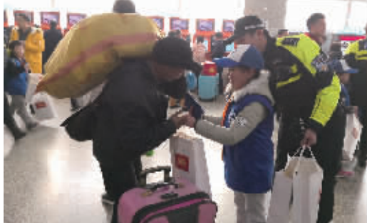
2月1日，长沙汽车西站售票大厅，长沙交警联合小志愿者向旅客赠送“平安出行”包。