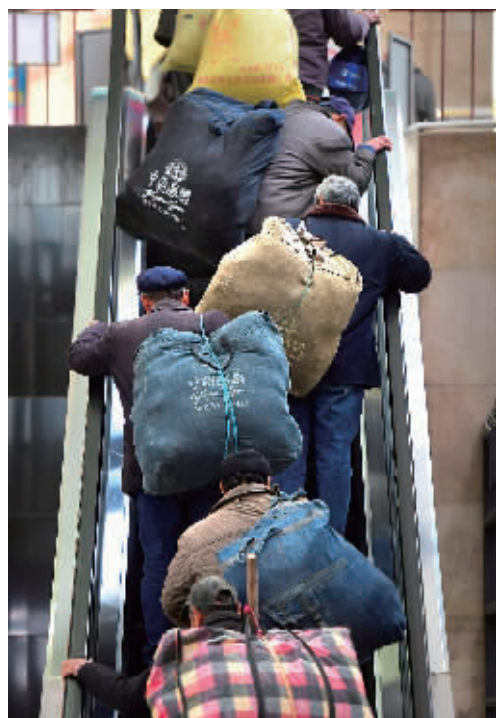
2月1日，长沙火车站，旅客背着大包小包行李进站。