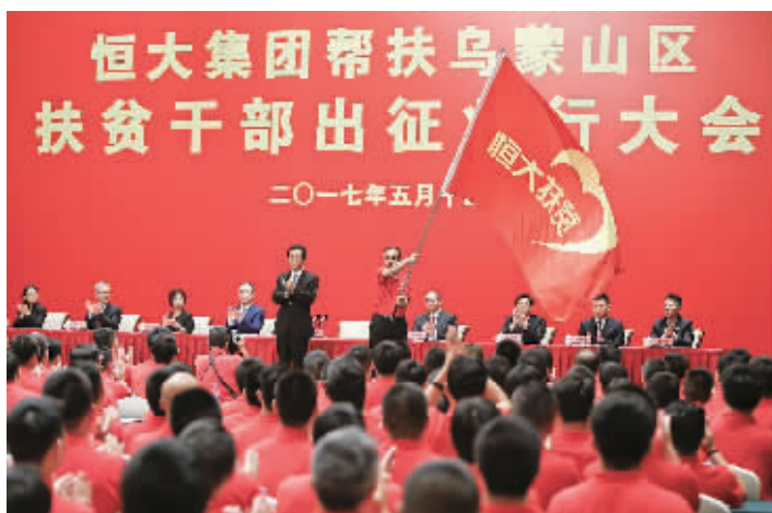
扶贫队员出征大会。