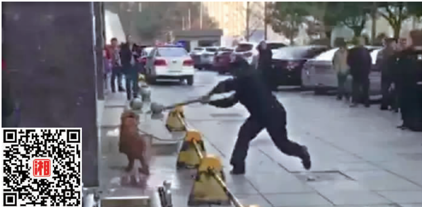
在长沙芙蓉南路“现代空间”小区楼下，民警对一条被拴住的金毛犬棒杀(扫描二维码查看视频)。