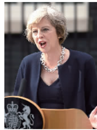
英国首相特雷莎·梅

特朗普的推特账号拥有4400万“粉丝”。他转发弗兰森发布的视频后，带火了后者的推特账号。路透社报道，弗兰森的账号关注人数涨至7.7万，几乎增长了50%。弗兰森还发帖，向特朗普致谢。 ■综合新华社