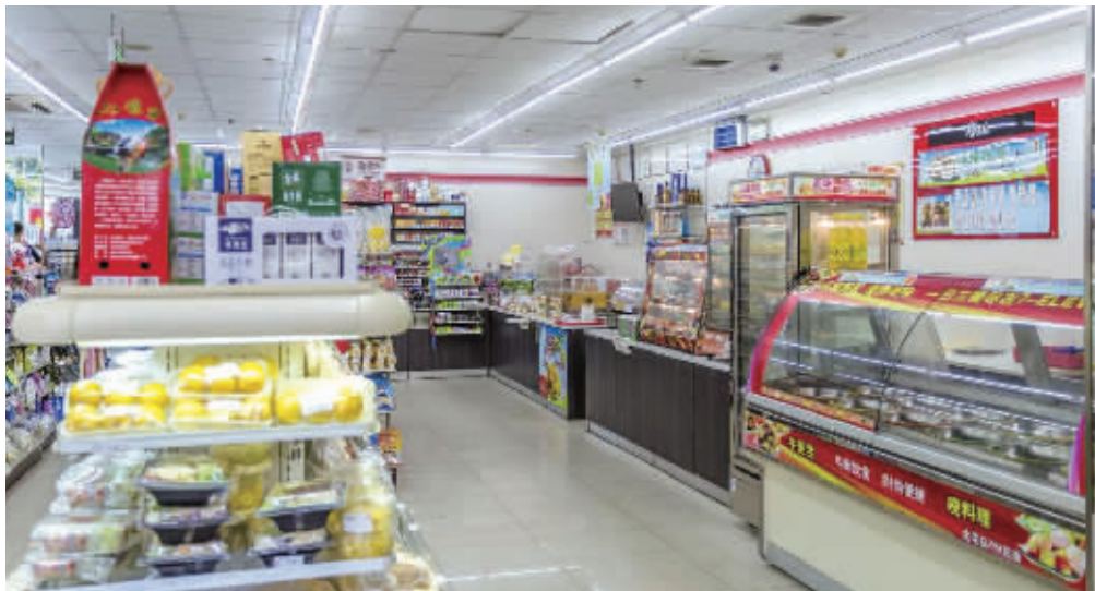
“便利店”开始跨界,除销售日常生活用品外,还有如鲜肉、蔬菜、水果等生鲜产品在售。(资料图片)

超市越开越小,与社区的距离越来越远,是消费者对有效商品和时间成本提出更高的要求。在“最后一公里”和“最后一小时”的争夺战中,新品牌不断涌现,便利店的现有经营方式是否会被打破? ■记者 朱蓉