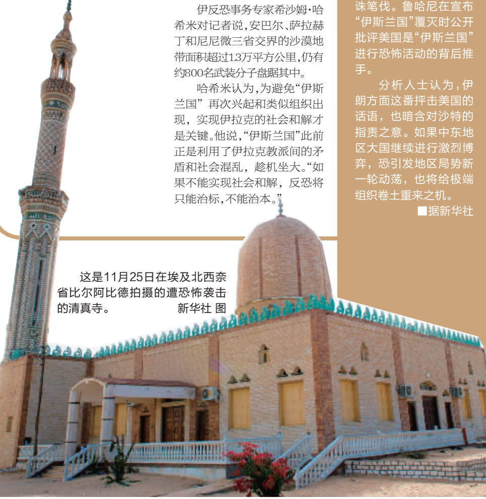
这是11月25日在埃及北西奈省比尔阿比德拍摄的遭恐怖袭击的清真寺。

哈希米认为,为避免“伊斯兰国”再次兴起和类似组织出现,实现伊拉克的社会和解才是关键。他说,“伊斯兰国”此前正是利用了伊拉克教派间的矛盾和社会混乱,趁机坐大。“如果不能实现社会和解,反恐将只能治标,不能治本。”