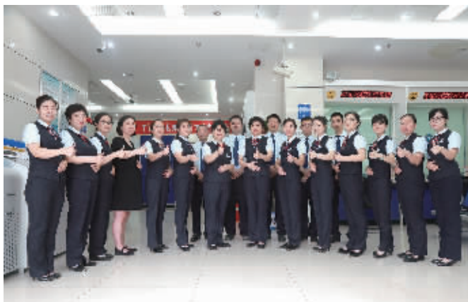
建设银行井湾子支行团队风采。