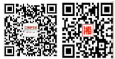
三湘都市报微信公众号 三湘都市报微博

如果，你在消费中发现“黑现象”、潜规则，请告诉我们；如果，你在消费过程中遇到质量、服务等问题，或者碰到不良商家，各种推诿不愿承担责任，消费权益得不到保障，不管哪个行业，请告诉我们，我们帮你维权。请记住我们的联系方式： 热线：0731-84326110 微博：三湘都市报 微信：三湘都市报微信公众号 (ID:sxdsb96258)