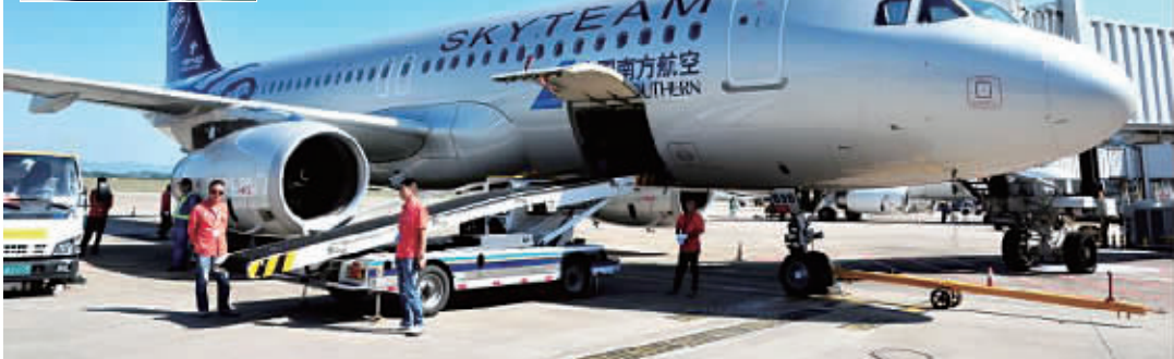
飞机货舱里都有啥？除了托运行李外，特产、宠物等也是货舱里的“常客”。