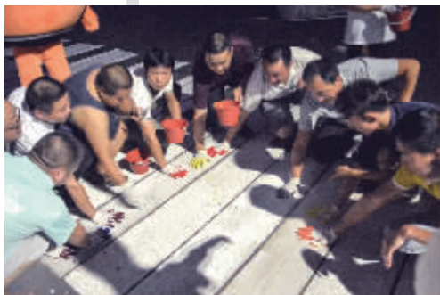
滴滴司机共同绘制斑马线,承诺安全出行。