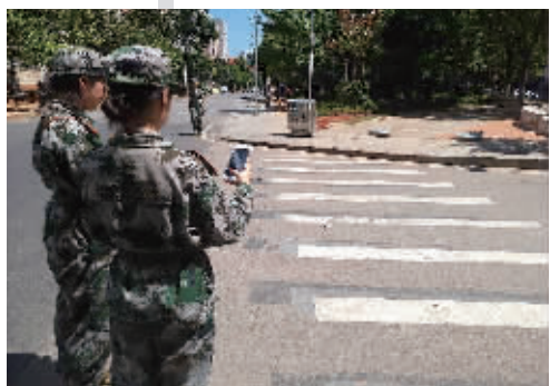
出现在校园里的斑马线引发了学生拍照围观。