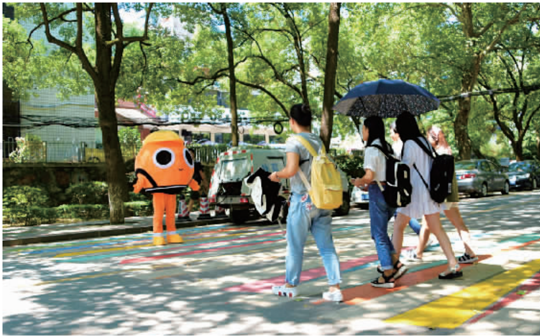
滴滴小桔人正在引导学生走斑马线,安全出行。

9月14日,在中南林业科技大学、中南大学内,几组由滴滴司机父子合作改造、充满创意的斑马线引发校内广泛关注。斑马线的改造使路口一改往日混乱无序的场面,转为了“车让人”的和谐场面。