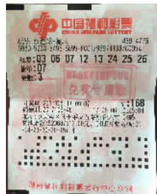
付先生的中奖彩票。

付先生是第二天早上起来查询中奖号码,才得知自己终于中奖了!第一个报喜电话就打给了老家的父母,向来对自己儿子信任有加的父母,完全没觉得儿子是在开玩笑,只是觉得儿子运气很好,提醒他规划好钱的用途。这位花168元就收获1539万元的年轻满哥,华丽地跻身千万富豪行列,他准备把奖金投入自己目前所从事的生意,让事业更上一层楼。■木子 经济信息