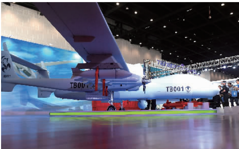
9月12日，观众在南宁国际会展中心参观展出的双尾蝎无人机。随着中国-东盟合作的日益深入，高新科技产品纷纷抢滩中国-东盟博览会，不断推动本区域产业转型升级。第十四届中国-东盟博览会首次设立智能制造装备展区，集中展示无人机、智能机器人、3D打印、智能消费电子等。