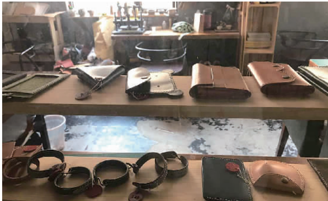
注入了时尚元素的传统手工艺品，逐渐受到年轻人欢迎，一些作品需要花费不少时间来完成，仍然吸引了很多客人。图为大叔的手工间，摆放的皮手环、皮卡包、零钱包等作品。

此外，借着手作市场兴起的东风，一些传统文化也找到与年轻人搭桥的新途径，例如智绘画堂成人书画推出的扇面体验课，将国画与手作结合，吸引了不少偏爱古风古韵的年轻人。