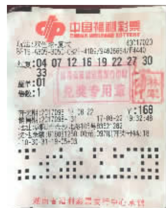
吴先生的中奖彩票。

示他还将继续支持福彩事业,以后也会通过自己的力量帮助身边需要帮助的人。■钟琪 经济信息