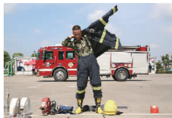
8月10日，军训教官骨干在进行消防专题培训。