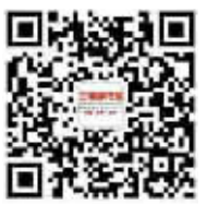
三湘都市报微信公众号

热线:0731-84326110 微信:三湘都市报微信公众号(ID:sxdsb96258) 微博:三湘都市报