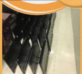
这30多台电脑都被安装了“掌上看家”软件。