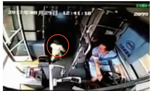
2岁多男童独自爬上52路公交车视频截图。