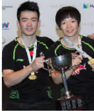
混双选手郑思维、陈清晨。