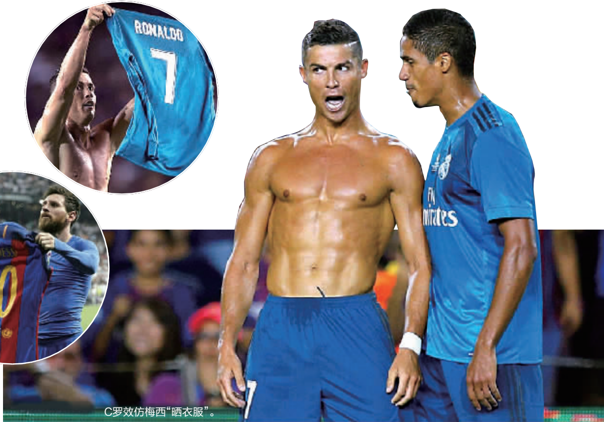
C罗效仿梅西“晒衣服”。