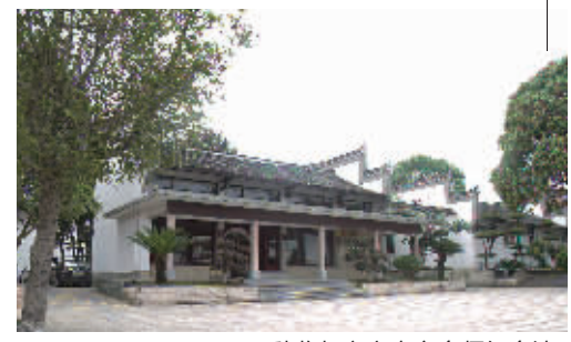
秋收起义文家市会师纪念馆。

位于沙溪村的沙溪屋场,居住村民多数姓陈,于明朝时期从江西九江迁居于此,至今已有近五百年历史。2016年10月开始,文家市镇全面启动沙溪屋场建设,借助全域旅游美丽浏阳创建的重大机遇,致力于“打造田园综合体,建设醉美文家市”,以全域旅游文家市献礼秋收起义90周年,迎接八方来宾。 如今,以沙溪屋场、红旗屋场、里仁屋场为代表的美丽屋场逐渐涌现。屋场在建设,乡村在成长,“望得见山,看得见水,记得住乡愁”的全域美丽文家市正在步步实现。