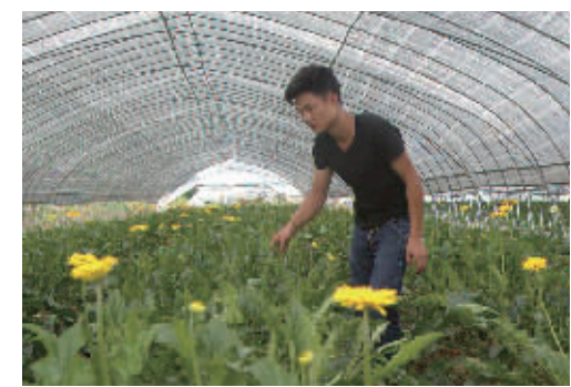
沙溪屋场,一名年轻人正在为花海进行整理修剪。

从长沙星沙收费站上长浏高速,到浏阳互通上平汝高速,向北1个小时的车程,便可到平江。平汝高速的“平”,指的即是平江。作为平江起义发生的地方,这里也是中国革命新生的一个起点。 1928年7月22日,彭德怀、滕代远、黄公略等在党的领导下,发动了声震全国的平江起义。这是继武昌起义、秋收起义和广州起义之后,中国共产党领导的又一次著名武装起义,成立了平江县工农兵苏维埃政府,建立了工农红军第五军。 在平江县党史研究员徐校雄看来,当时的平江交通便利,地邻长沙,工人力量集中,加上平江人与生俱来的血性性格,天生带有不甘于压迫、敢于反抗的基因,为起义提供了有利基础。