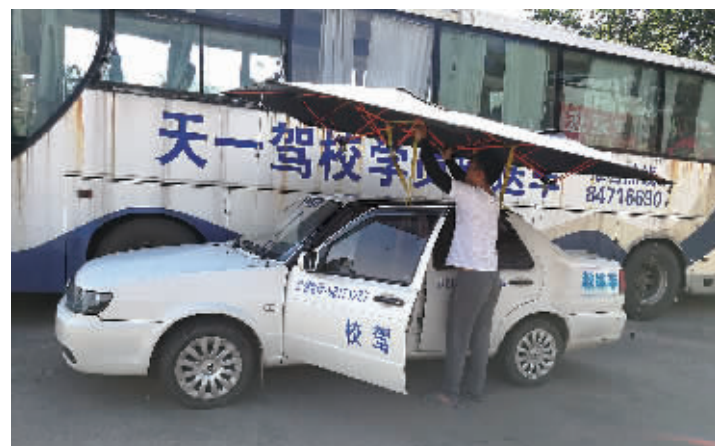
教练在给教练车装“遮阳伞”。

本报7月25日讯 近日,长沙温度居高不下,这对于练车的市民来说,成了令人头痛和心烦的事。为了让学员安心练车,长沙各驾校也是纷纷出招迎战高温天。